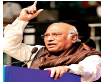
कांग्रेस अध्यक्ष मल्लिकार्जुन खरगे

उन्होंने कहा, आपके 'डबल इंजन' ने मणिपुर की निर्दोष जनता की जिंदगियों को रौंद दिया। अब समय आ गया है कि आप मणिपुर में कदम रखें और पीड़ित लोगों के दर्द और पीड़ा को सुनें और उनसे माफी मांगें। खरगे ने सवाल किया, "क्या आपमें यह साहस है?" उन्होंने दावा किया, मणिपुर की जनता आपको और आपकी पार्टी को माफ नहीं करेगी।