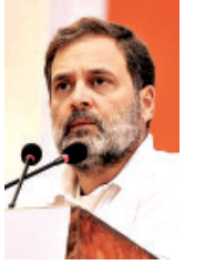
मणिपुर में राष्ट्रपति शासन

नई दिल्ली। लोकसभा में नेता प्रतिपक्ष राहुल गांधी ने आरोप लगाया कि मणिपुर में राष्ट्रपति शासन लगाना भारतीय जनता पार्टी (भाजपा) की ओर से शासन करने में उसकी अक्षमता की देर से की गई स्वीकारोक्ति है। उन्होंने कहा कि अब प्रधानमंत्री नरेन्द्र मोदी मणिपुर के प्रति अपनी जिम्मेदारी से इनकार नहीं कर सकते। कांग्रेस के पूर्व अध्यक्ष राहुल गांधी ने 'एक्स' पर पोस्ट किया, मणिपुर में राष्ट्रपति शासन लागू करना भाजपा द्वारा मणिपुर में शासन करने में उसकी पूर्ण अक्षमता की देर से स्वीकारोक्ति है। अब प्रधानमंत्री मोदी मणिपुर के लिए अपनी सीधी जिम्मेदारी से इनकार नहीं कर सकते।